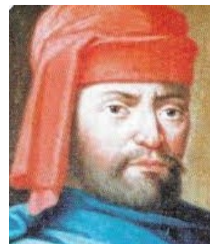
Accademia Masoliniana di Panicale

Domenica 13 Novembre 2022 ore 16:00 Teatro Cesare Caporali di Panicale